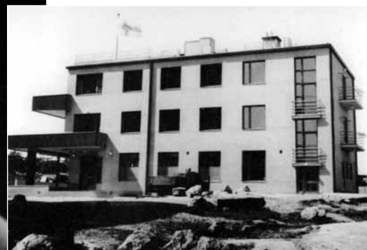
Ensi koti valmiina vihkiäisissä kesäkuussa 1942.