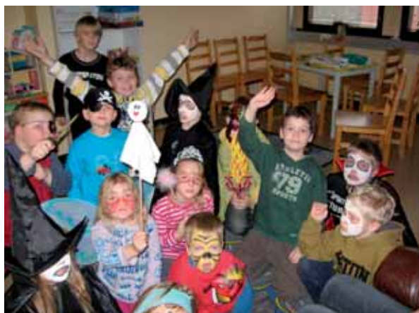
Iltapäiväkerholaiset viettivät syysjuhlaa marraskuun alussa. Lapset olivat varustautuneet päivään huolellisesti.

Lapsiperheiden kohtaamispaikka tarjoaa kaikille vanhemmille lapsineen ohjattua toimintaa ja vapaita seurustelua. Tätä ryhmää toteu-