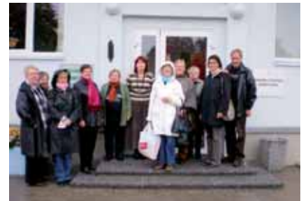
Vuoksenlaakson matkalaiset Pärnussa.